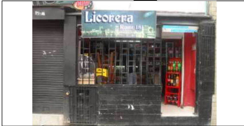
Registro fotográfico, Visita de Seguimiento al Requerimiento Efectuada el día 02-10-2015